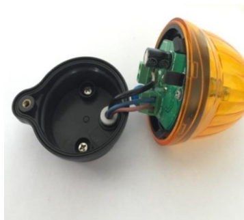
Obrázok 5 / Picture 5 / Zdjęcie 5

5. Pripojte vodiče k svorkám elektroniky majáku.