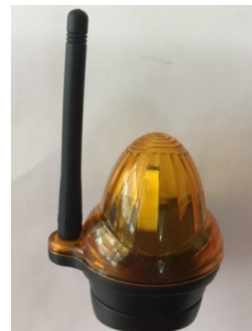
Obrázok 6 / Picture 6 / Zdjęcie 6

6. Osadte horný priehľadný kryt majáku na stojan a upevnite ho naskrutkovaním antény.