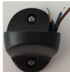
Obrázok 3 / Picture 3 / Zdjęcie 3

3. Vodiče prevlečte cez konzolu. Následne pripevnite kozolu na stenu pomocou priložených skrutiek.