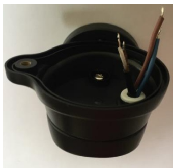
Obrázok 4 / Picture 4 / Zdjęcie 4

4. Prevlečte vodiče cez vodotesnú priechodku v stojane majáku. Upevnite stojan na konzolu majáku.