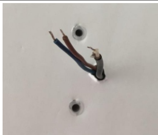
Obrázok 2 / Picture 2 / Zdjęcie 2

2. Ako je uvedené v obrázku, vyvrtajte v mieste osadenia dva otvory s 6mm priemerom a 35mm hĺbkou. Vzdialenosť otvorov je 40 mm. Do otvorov vložte hmoždinky.