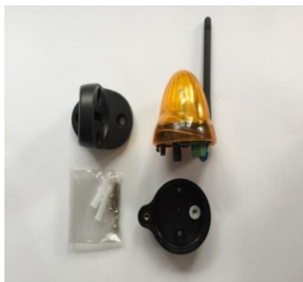
Obrázok 1 / Picture 1 / Zdjęcie 1

1. Otvorte krabicu a vyberte maják a príslušenstvo k inštalácii